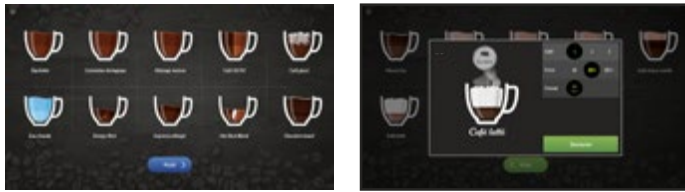
Thème par défaut : bleu